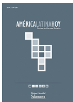
América Latina Hoy Revista de Ciencias Sociales

Es una publicación del Instituto de Iberoamérica que se edita tres veces al año y ofrece estudios de la realidad latinoamericana desde la perspectiva política, la historia, la economía y la literatura, entre otras disciplinas. Actualmente, se encuentra en línea el último número dedicado a Paraguay. Visitar: