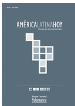
América Latina Hoy Revista de Ciencias Sociales

Editores: Leonardo Díaz Yepes, Efraín Bámaca y Tomáš Došek Diseño: Ángel Badillo