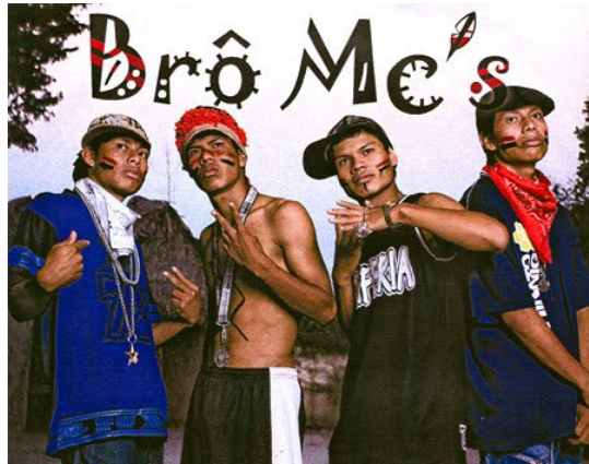
Portada del CD Brô Mc's

Tampoco hay una presencia física del no indígena, pero las características sincréticas están más en evidencia en Brô Mc's a través de la apropiación del rap y de la relación con el modo de vida de los raperos brasileños que viven en las zonas pobres del país.