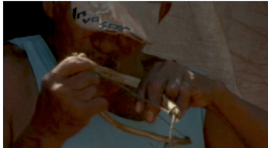
escena de Porahéi

El documental Porahéi o el canto guaraní, filmado en la comunidad Te'Yíkue en Caarapó (Mato Grosso del Sur), tiene como enfoque principal la religiosidad guaraní. Fue producido por un grupo de 18 guaraní, durante el taller de formación en audiovisual realizado en la comunidad Te'Yíkue, en Caarapó (Mato Grosso del Sur).